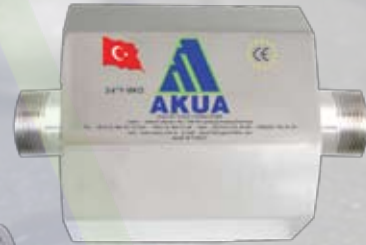
3/4"Y - 1" - 1/4" - 1/2"